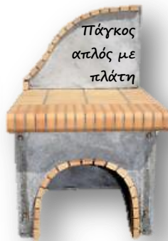
Πάγκος απλός με πλάτη