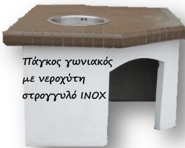
Πάγκος γωνιακός με νεροχύτη στρογγυλό INOX